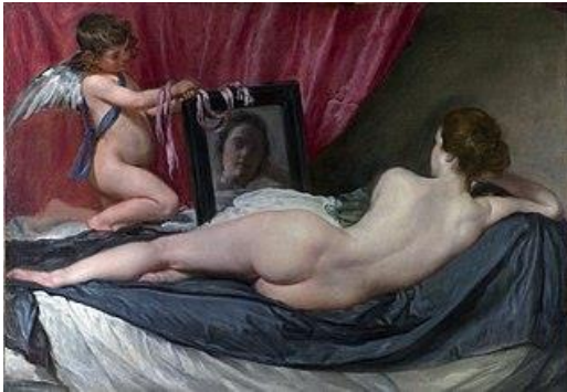
Venus de Velázquez